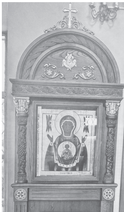
Икона Божией Матери «Знамение».

благоустройству: отремонтирован приходской дом, построены просторные гаражи, выполняющие функции склада для рабочего и другого крупного инвентаря, благоустроена автостоянка. Внутри храмовой ограды руками заботливых прихожан посажены липы, рябины, яблони, черемуха, ели. В летний сезон за алтарём яркими, пёстрыми красками цветут различные цветы, разрастается и другая декоративная зелень.