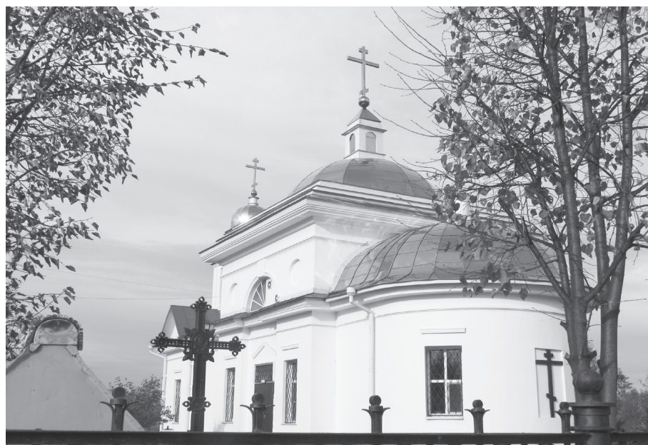
Храм Вознесения Христова в наши дни.

Использована информация газеты «Время», № 8 от 31.08.2022 г., сайта NTagil.BeZFormata.com