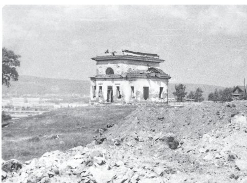
Руины храма. 1989 год.