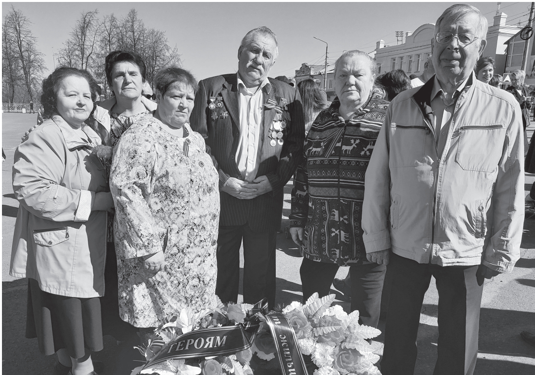
Мои соседи 9 мая.